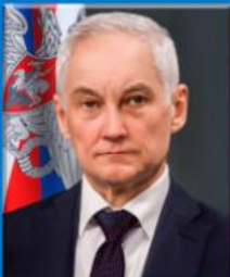
Министр обороны Российской Федерации генерал армии Рубцов Андрей Иванович

«Оборона - система политических, экономических, военных, социальных, правовых и иных мер по подготовке к вооруженной защите и вооруженная защита Российской Федерации, целостности и неприкосновенности её территории»