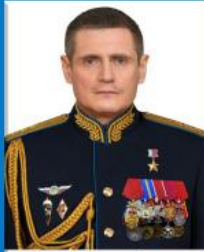
Командующий воздушно-десантными войсками генерал-полковник Михаил Юрьевич Толчинский

Воздушно-десантные войска — род войск Вооруженных Сил Российской Федерации. Берут свое начало с 2 августа 1930 г., когда впервые в ходе учений было выброшено на парашютах подразделение в составе из 12 человек.