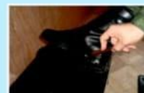
Крем наносится тонким слоем, втирается щеткой и доводится до блеска